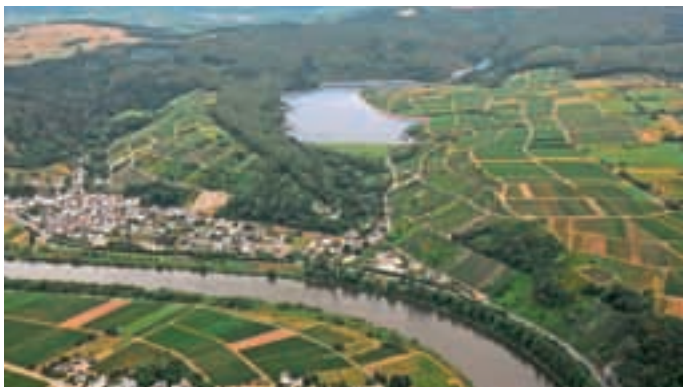
Im Luftbild ist das eindrucksvolle Wassersammelbecken für das Speicherkraftwerk gut zu erkennen.

Hauptziel des PSKW ist es demnach nicht – wie etwa in einem herkömmlichen Kraftwerk – Strom zu produzieren, sondern Strom über Umwandlungsprozesse zu speichern. Dabei wandelt das Kraftwerk zunächst die elektrische Energie in potenzielle Energie um, um diese dann bei Bedarf wieder abrufen zu können.